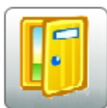
Google Sitemap fil generator

Filen genereres fra administrationen af IOS webshoppen, og det forgår således at der aktiveres en funktion som gennemløber hele varesortementet og danner en indexbar fil som bliver sat til rådighed for Google.